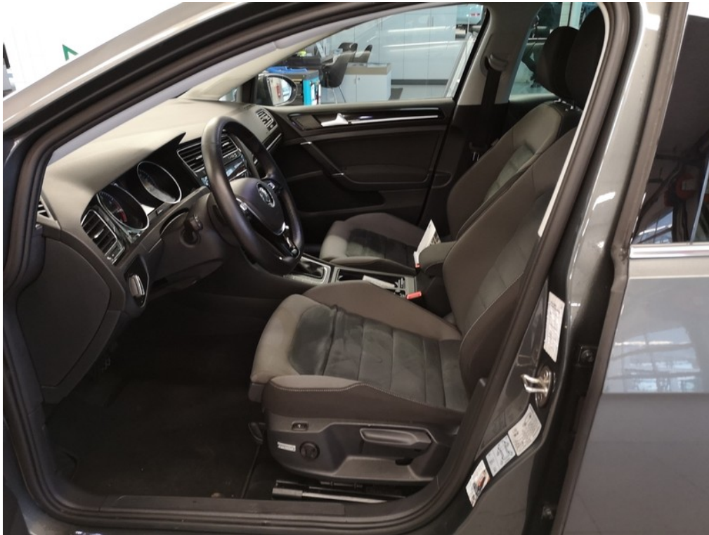
Interiér z levé strany