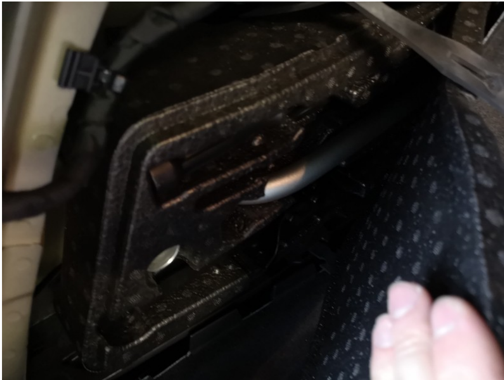
Rezervní kolo / sada na opravu