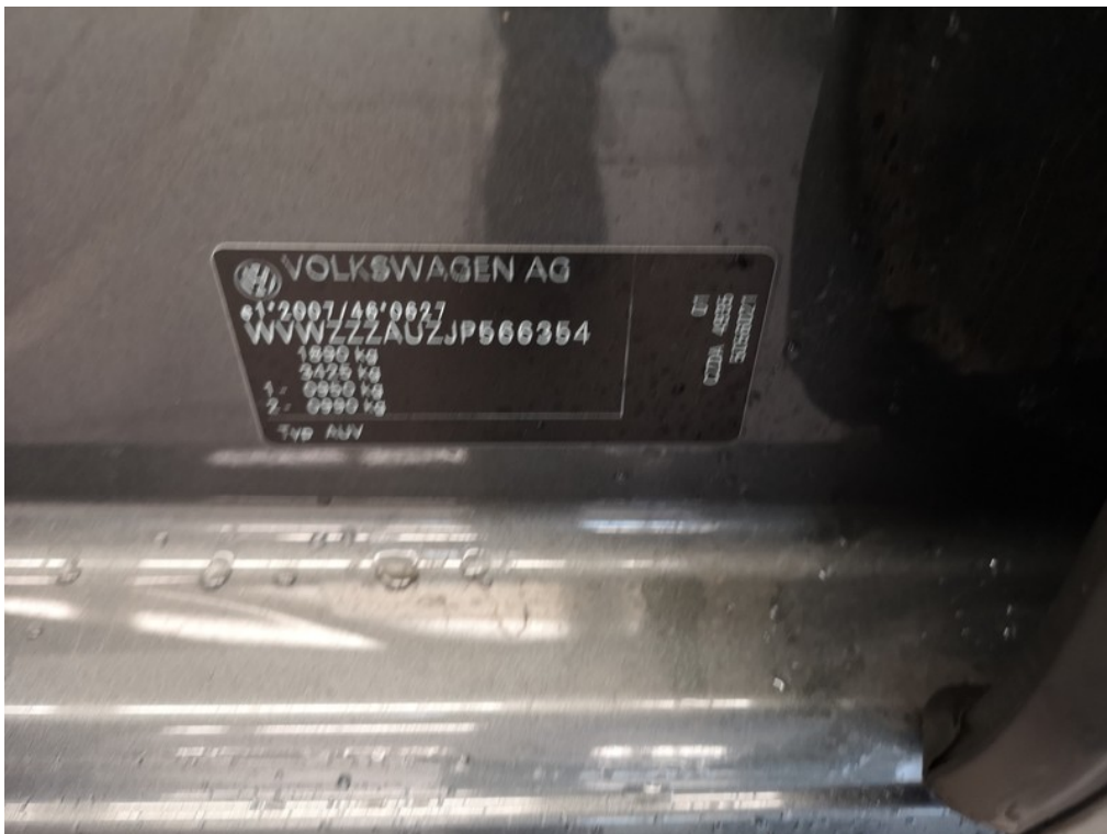
VIN / výrobní štítek