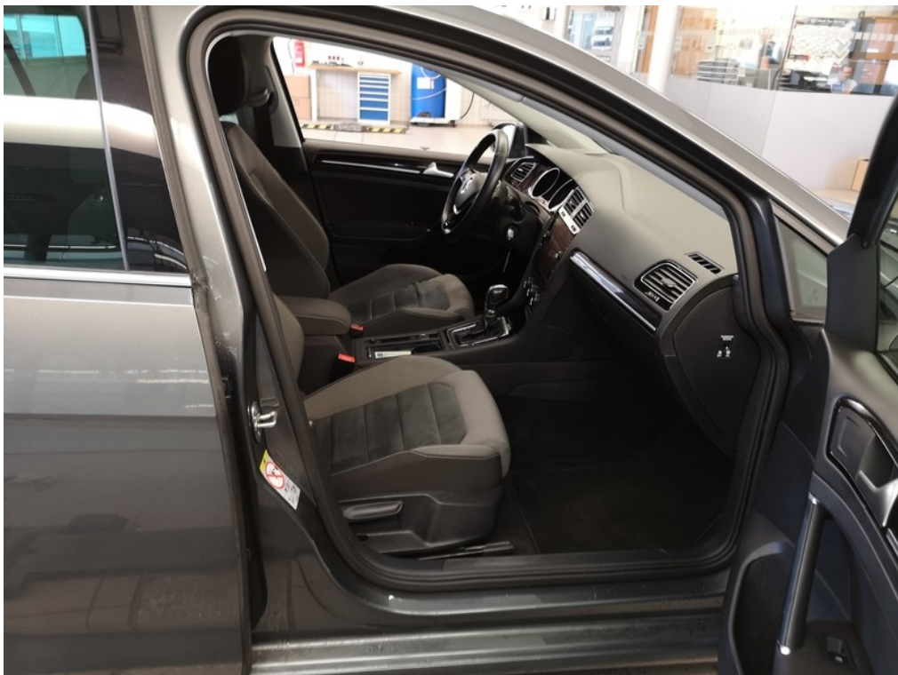
Interiér z pravé strany