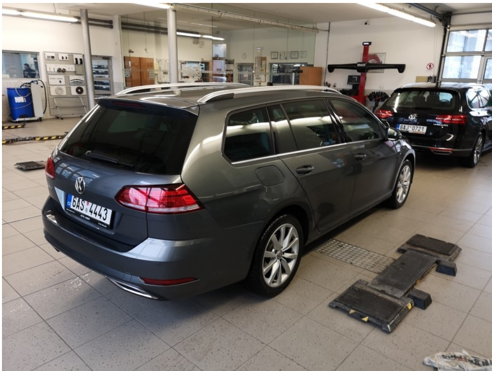
Pohled zezadu zprava