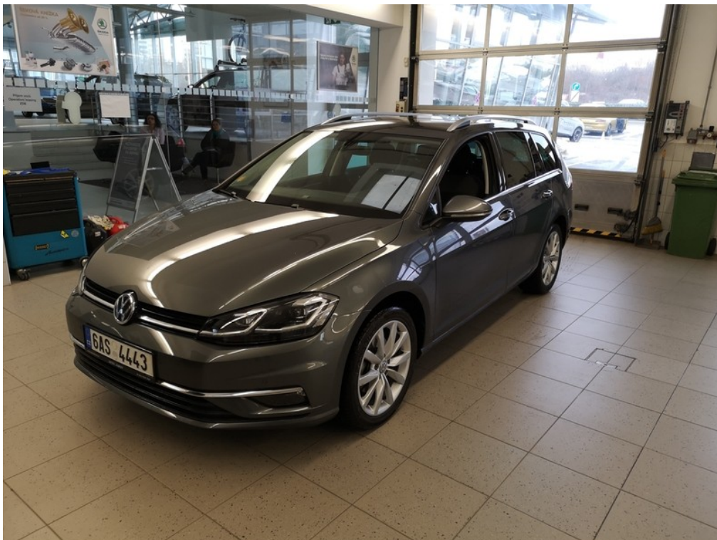
Pohled zepředu zleva