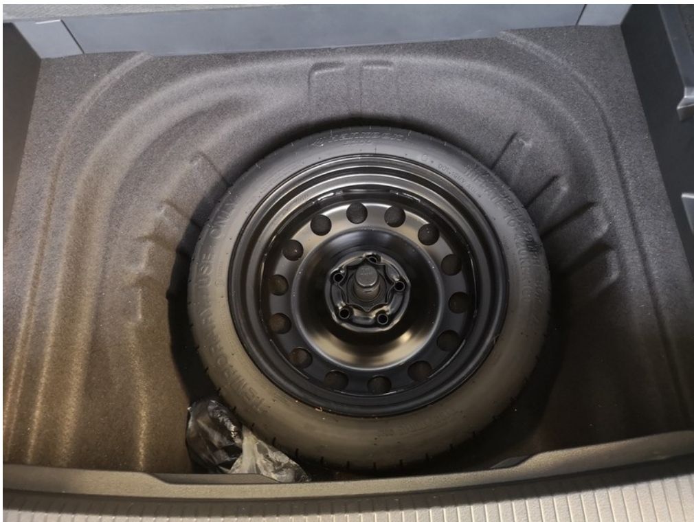
Rezervní kolo / sada na opravu