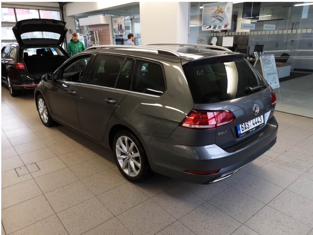
Pohled ze zadu zleva