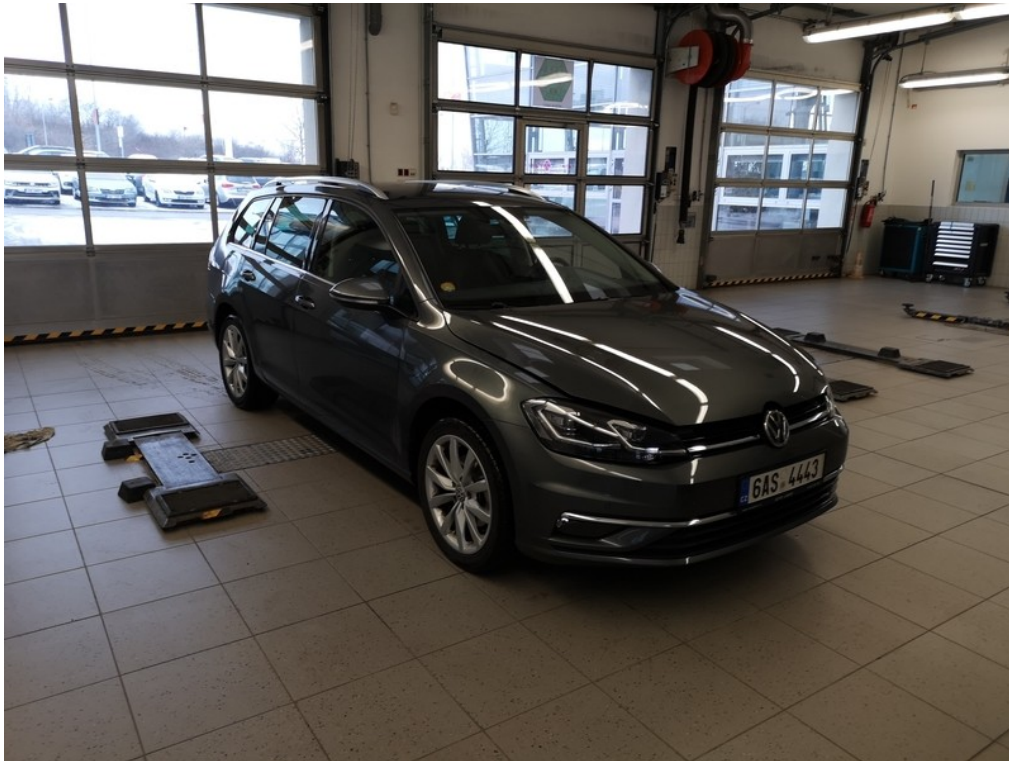
Pohled zepředu zprava